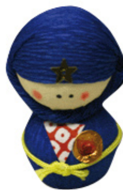
Okiagari koboshi, le culbuto japonais ; ici dans sa version autodéfense intellectuelle ninja.