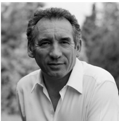
François Bayrou : effet bof entre deux pôles factices gauche-droite

Ceci dit, il devient très facile de repérer la fabrication de faux « pôles », de faux « extrêmes », et donc de faux dilemmes entre lesquels il vous faudrait absolument vous situer. Il y en a des super-fastoches : gauche et droite, par exemple, dont l'effet bof répond au doux nom de François Bayrou.